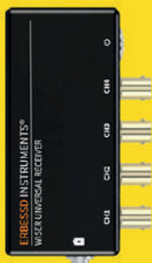
Receptor Universal Inalámbrico