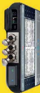
Recolector de Datos

WiSER 3X puede conectarse fácilmente y de forma fiable a la mayoría de los instrumentos de vibración y balanceo de otras marcas utilizando el receptor universal WiSER.